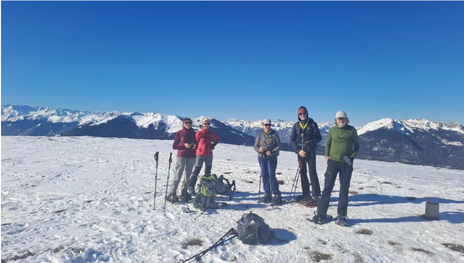
Au sommet du Puech